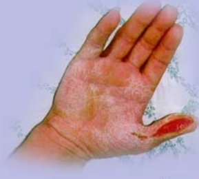
۳- پرتوگیری داخلی:

این پرتوگیری شایعترین نوع در سوانح پرتوی می باشد. در این نوع پرتوگیری، در نواحی که در معرض پرتو قرار گرفته‌اند، نشانه‌ها و علائمی مانند اریتم، ادم، دسکواموسین خشک و مرطوب، ناول، درد، تکرور و ریزش مویجاد می‌شود. شدت علائم بستگی به دز دریافتی، نوع پرتو و محل و اندازه ناحیه پرتو دیده می‌باشد. پرتوگیری موضعی ناشی از پرتوها در دزهای بالای ۱۰-۸ گری ممکن است نشانه‌ها و علائمی شبیه سوختگی حرارتی ایجاد کند.